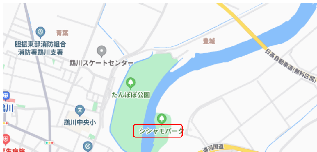
【大会会場位置図】(鷓川橋上流・鷓川左岸、シシ)

※ブログのURL⇒ https://ameblo.jp/jscf2024jimukyoku